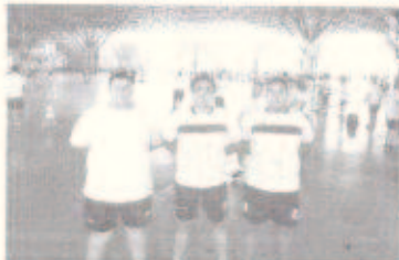
Foram 47 recomendações... Árbitros de Irati, em Irati, receberam capacitação...